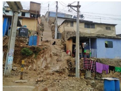
Olla Común Maria Cristina